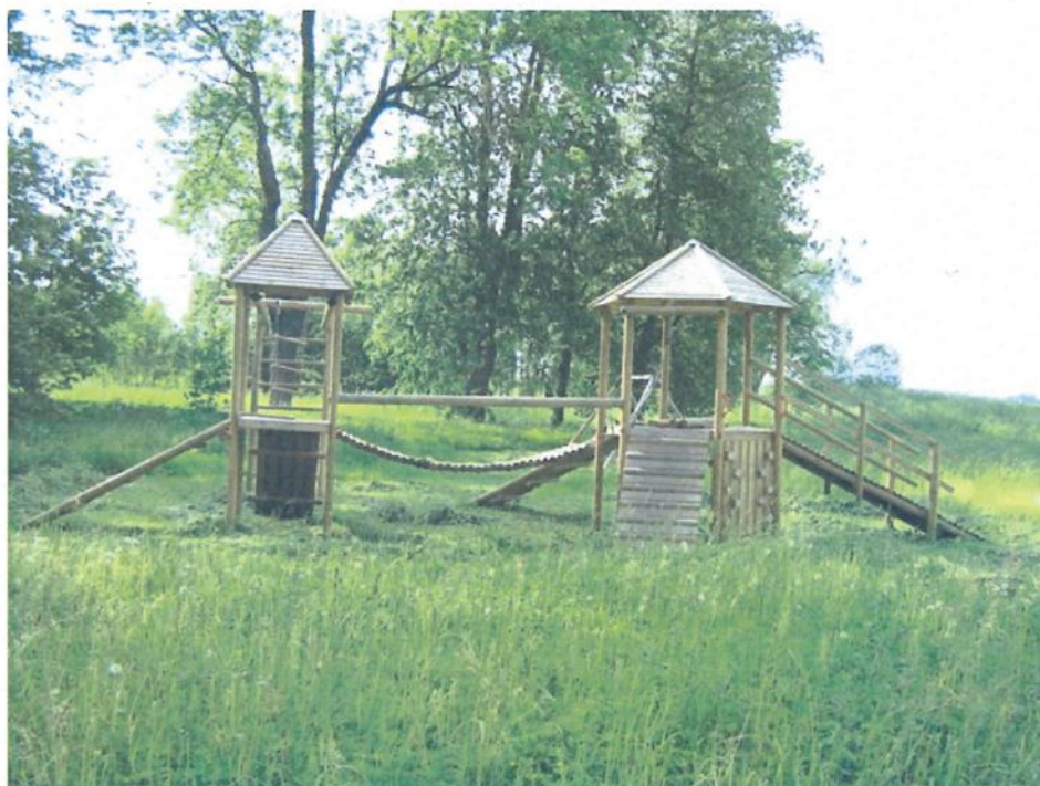
Parko teritorijoje kaimo bendruomenė įrangė žaidimų aikštelę vaikams