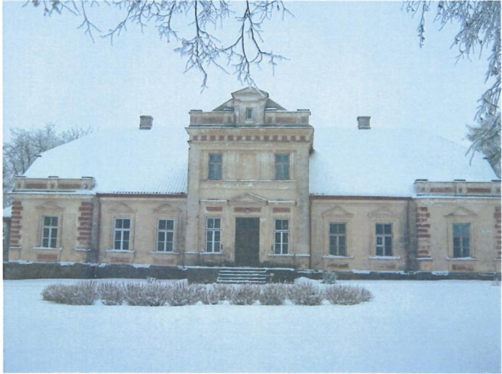
Dvaras žiemą.