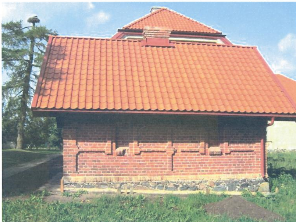
Dvaro ledainė.