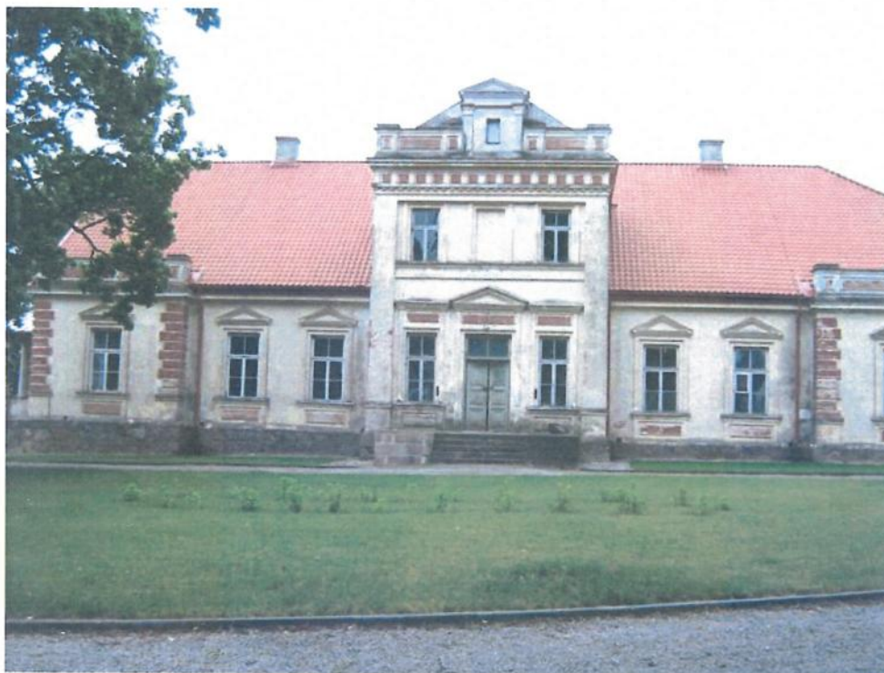
Dvaras 2009 m. pavasarį. A. Stulginskienės nuotr.